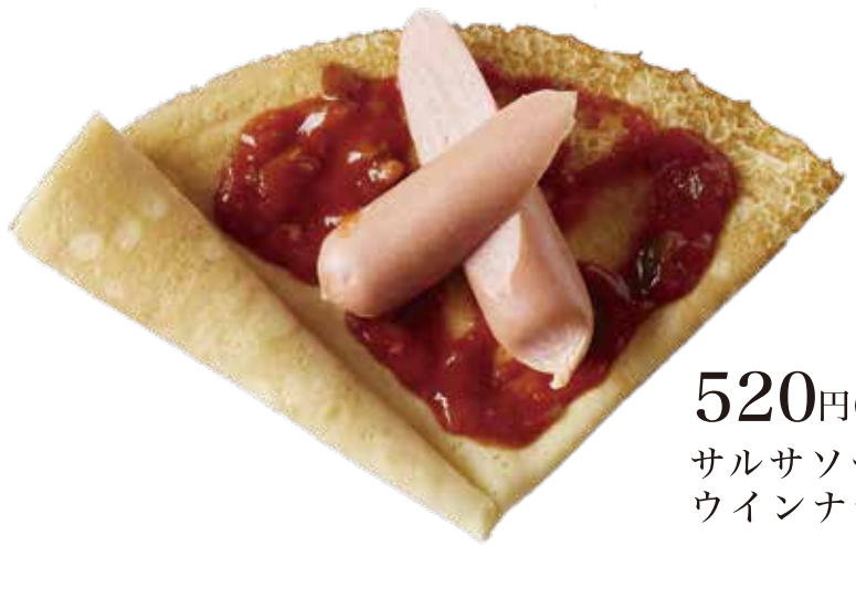
HOT サルサウインナー