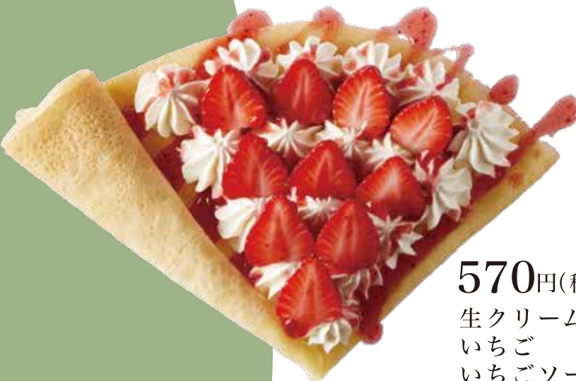
いちご生クリーム