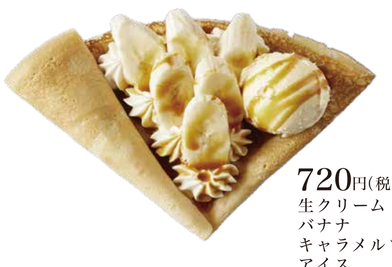
キャラメルバナナ生クリームアイス