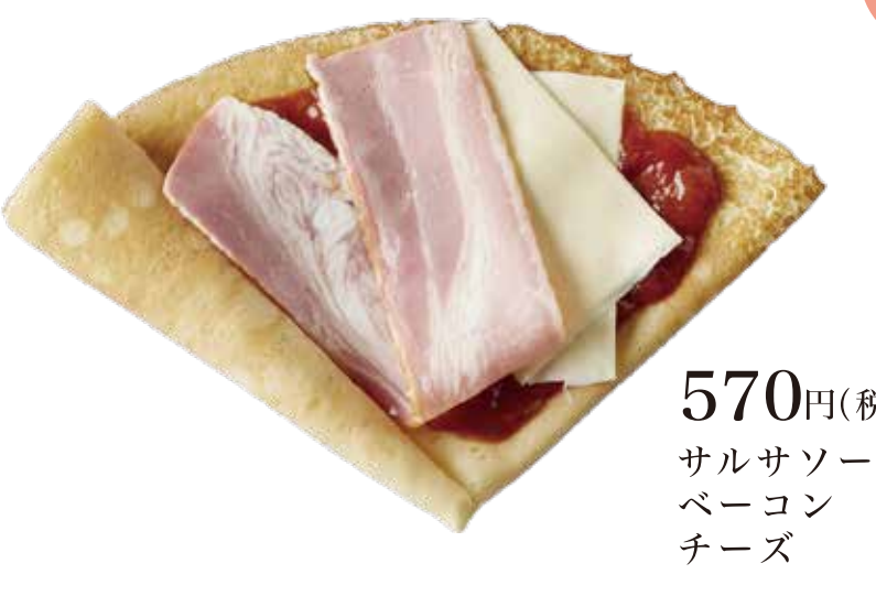
HOT サルサベーコンチーズ