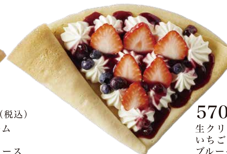
ミックスベリー生クリーム