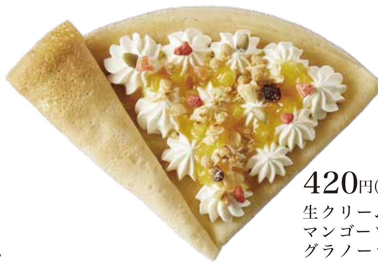
マンゴー生クリーム