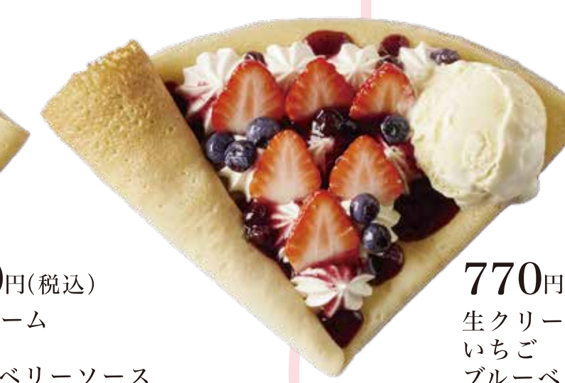
ミックスベリー生クリームアイス