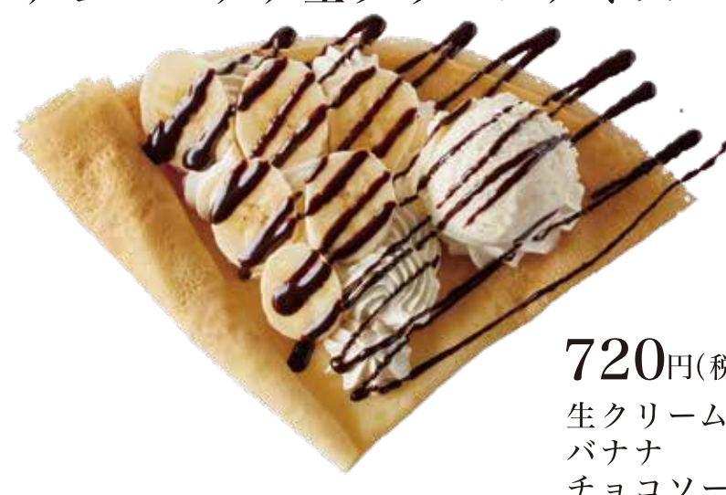
チョコバナナ生クリームアイス