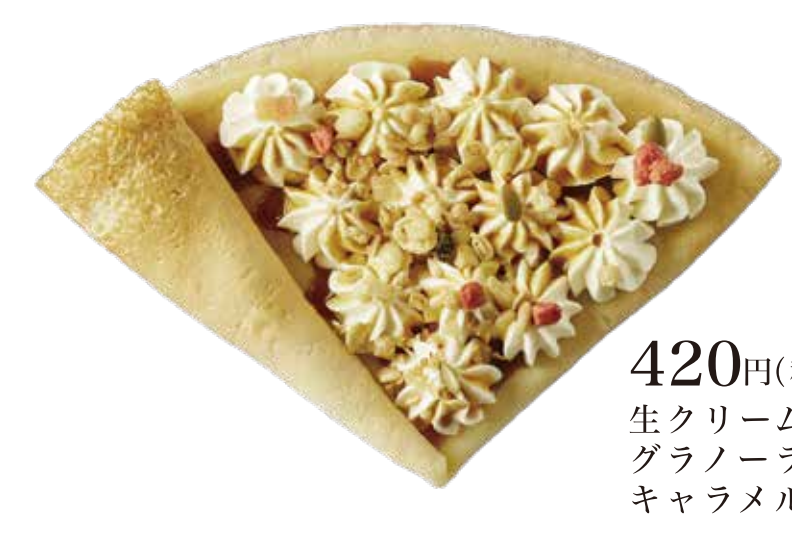
キャラメル生クリーム