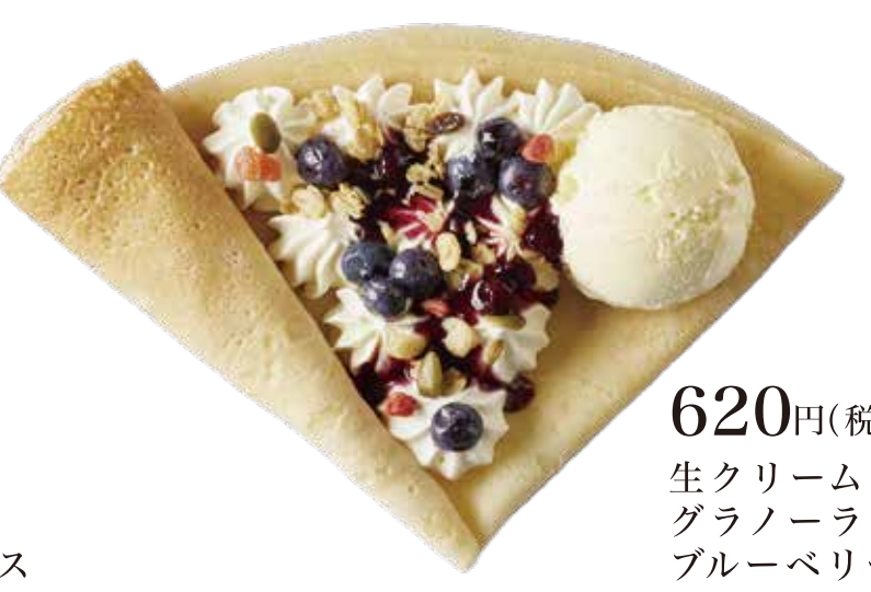
ブルーベリー生クリームアイス