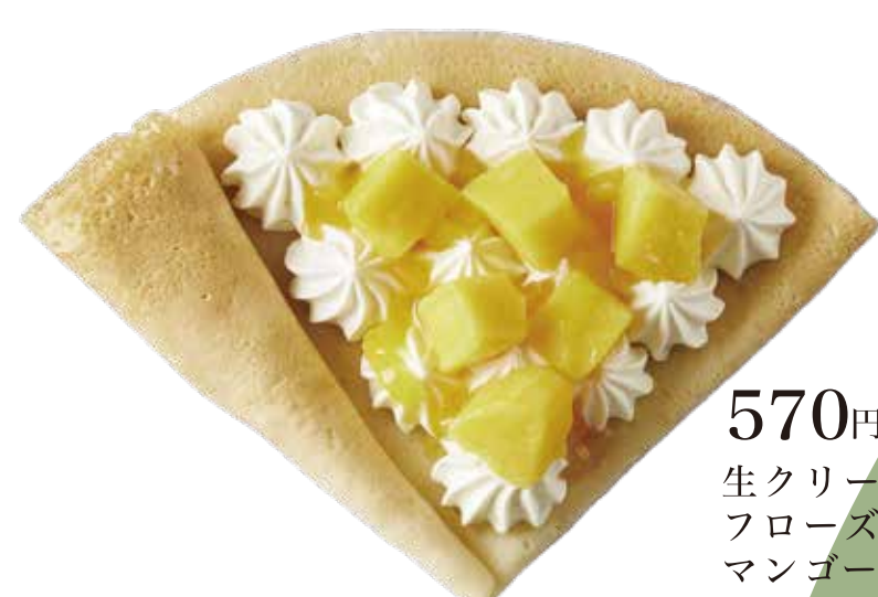
果肉マンゴー生クリーム