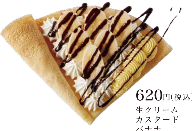
チョコバナナ生カスタード