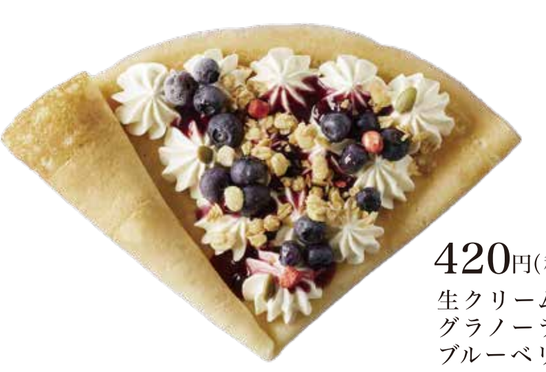
ブルーベリー生クリーム