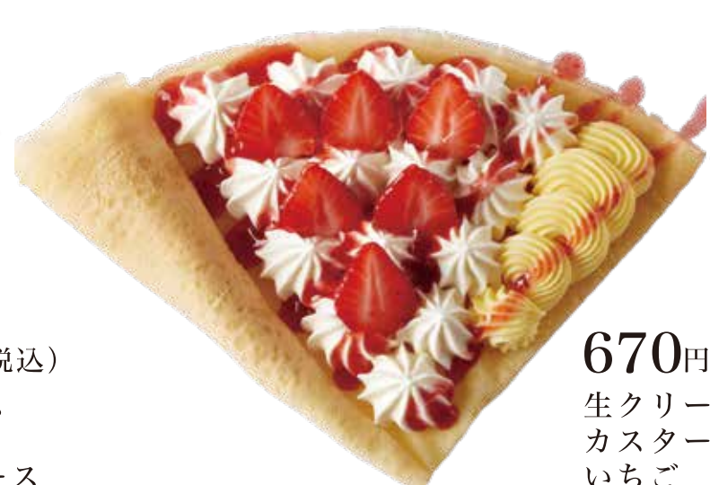
いちご生カスタード