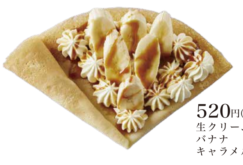
キャラメルバナナ生クリーム