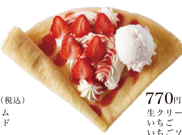
いちご生クリームアイス