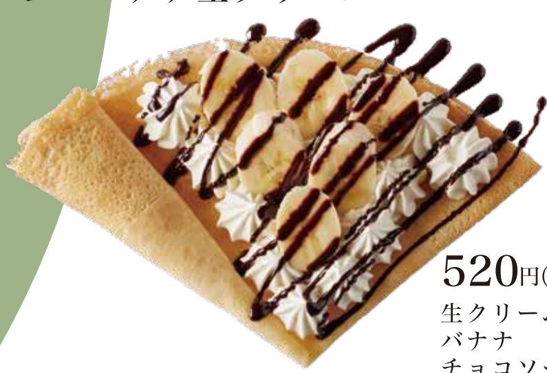
チョコバナナ生クリーム