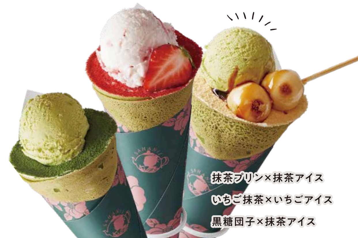
抹茶プリン×抹茶アイス いちご抹茶×いちごアイス 黒糖団子×抹茶アイス