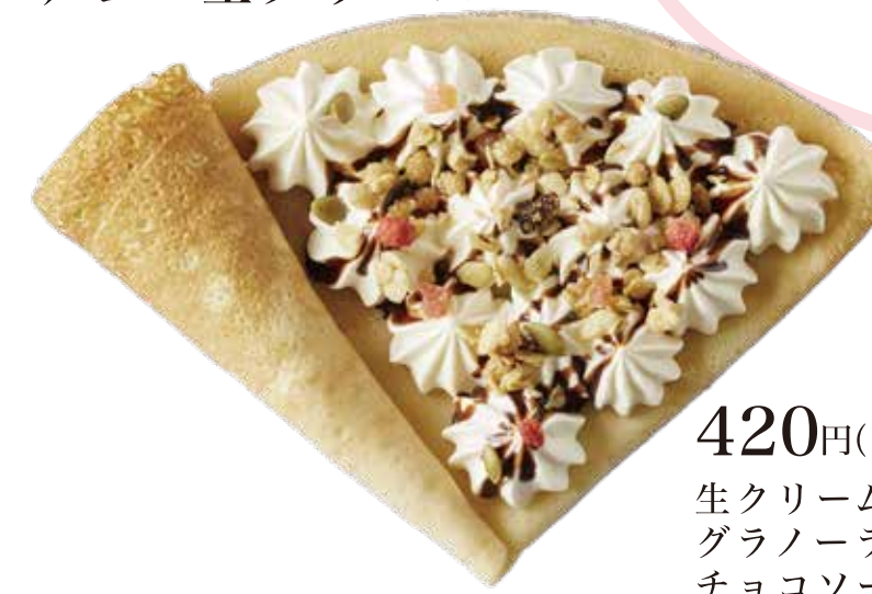
チョコ生クリーム