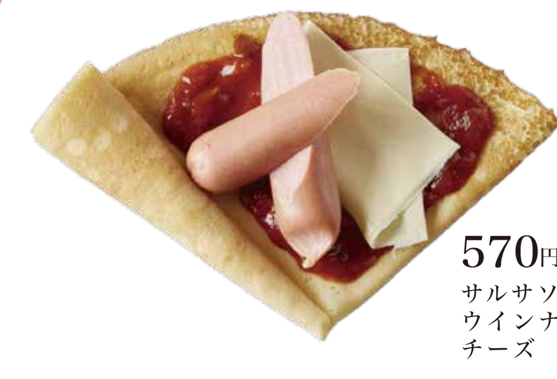
HOT サルサウインナーチーズ